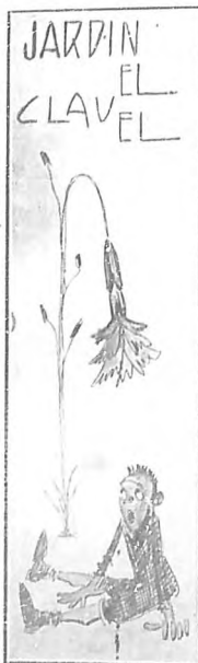
Caricatura de Rafael Blanco, anunciadora del Jardín "El Clavel" adquirida por los señores Armand.

Llama la atención porque demuestra que hay competencia... y flores en una ciudad como la Habana en donde es difícil, en un momento dado, proveerse de una flor ó de un modesto ramo, en donde no hay un mercado de flores; en donde estas se venden bien a la puerta de algún café, lugar poco propio para ser frecuentado por damas, ó en los mercados, junto al puesto de carne ó de verdura, lugares tampoco apropiados para ser visitados por damas, ó por escasos vendedores ambulantes cuya indumentaria y destemplada manera de vocear quita belleza a flores y plantas.