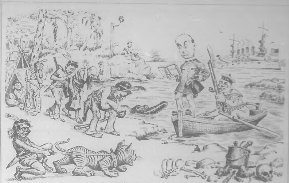
L.M.A. - SIBONEY. EL MISIONERO KNOX VISITA LAS TIERRAS DEL CARIBE