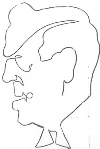
"El Vicepresidente" caricatura de Armando R. Maribona, recomendada por el Jurado.

Después de la exposición que se hizo en "El Píncel" de los trabajos presentados en nuestro Concurso, las reproducciones que hoy publicamos acaban de dar idea de lo que fué aquel.