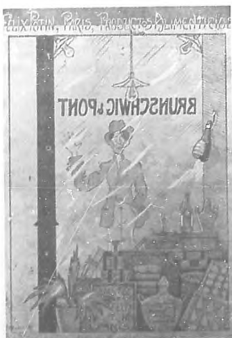
Caricatura anunciadora de los productos de la casa de Félix Potin, de París; original de Armando R. Maribona.