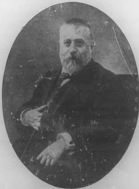
Don Marcelino Menéndez y Pelayo

Ya tiene su premio Menéndez y Pelayo. La inmortalidad: premio menos efímero que cualquiera obtenido en la tierra por muy honroso que fuese, como lo es el antes citado.