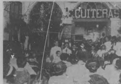
Aspecto de la velada celebrada en la "Asociación de Proprietarios, Industriales y Vecinos del distrito Este", con motivo de otorgarse el premio Ramón Quirós. (Véase la página dedicada a Instrucción).

No pudo faltar la nota desagradable que turbaba el general recibimiento.