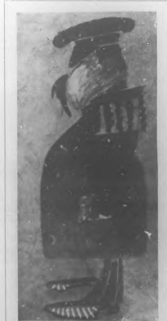
Morales Cejola. Caricatura de Rafael Blanco que obtuvo el premio de BOHEMIA á la mejor Caricatura popular.

Esta página la dedicamos especialmente al original Rafael Blanco, cuyas son las dos caricaturas que reproduci-