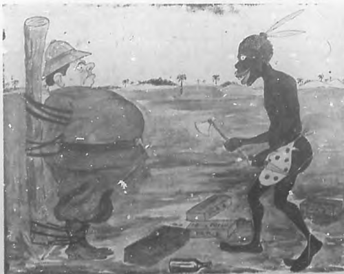
Caricatura anunciadora de los productos de la casa de Félix Potin de París: original de Bernardo Navarro.