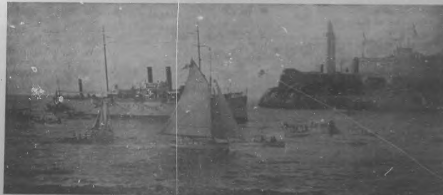
El "Patria", escuela naval, al entrar en bahía, el día 21 del corriente mes.