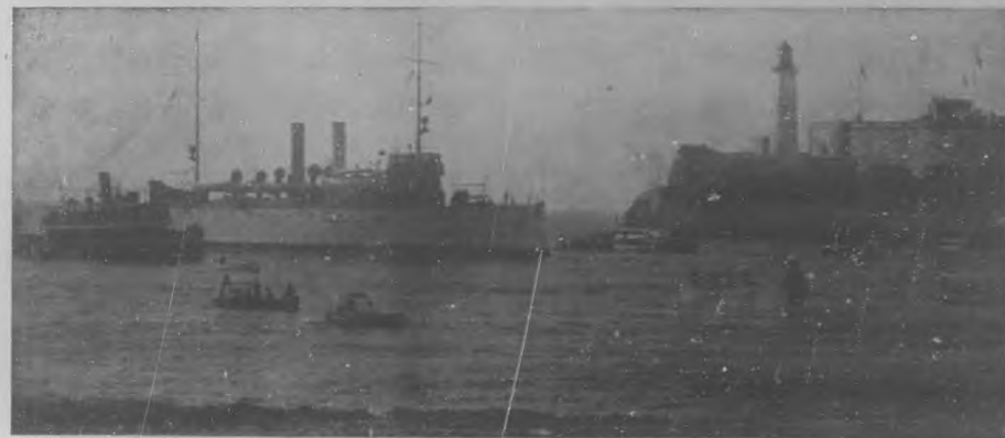
El nuevo crucero "Cuba" al pasar frente al Morro dirigiéndose a la bahía, el día 21 del corriente.

Como era de esperar, el recibimiento de que fueron objeto los nuevos buques de nuestra marina, cruceros "Cuba" y "Patria", escuela nava! éste, fué tan entusiasta como afectuoso.