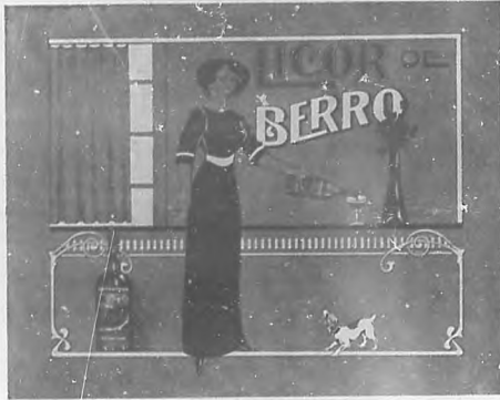
Dibujo anunciador del producto "León de Berro": Original de Arturo Pérez Cuesta, premiado en nuestro concurso.

La acreditada fotografía de Solís se ha trasladado á la calle de S. Rafael No. 22, intalando el estudio con todos los elementos más modernos.